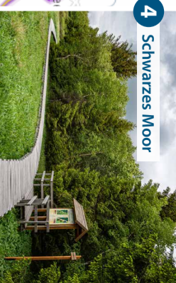
4 Schwarzes Moor