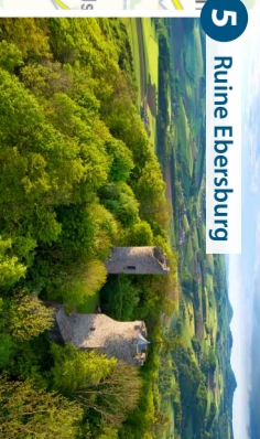
5 Ruine Ebersburg