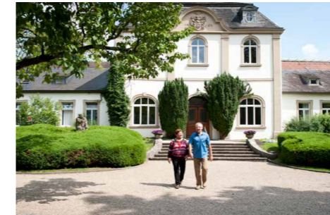
D Pavillion im Kurpark